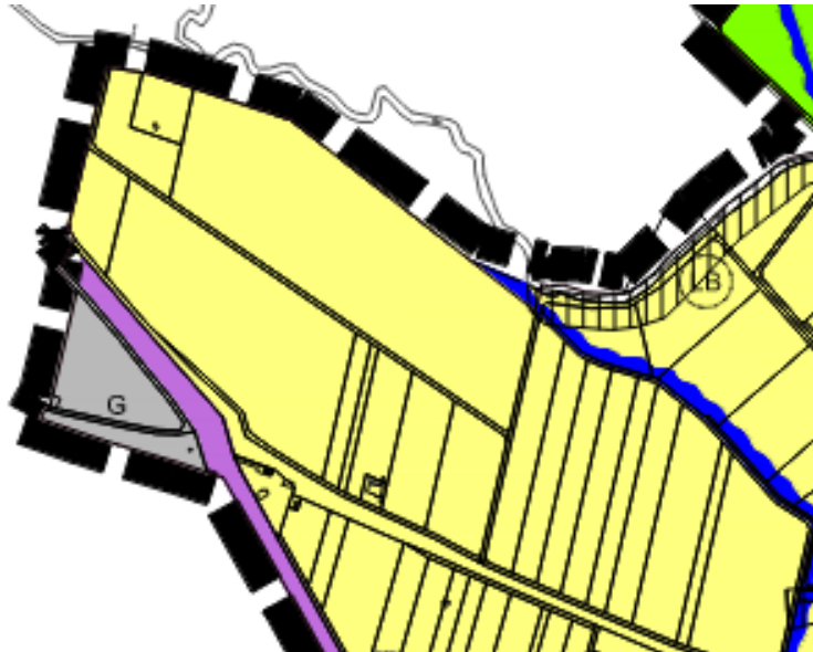
Abb. 3: Auszug Flächennutzungsplan Stadt Schweinfurt (Fassung Dezember 2024)

Im Rahmen des Wettbewerbs der EU um Standorte für die Errichtung sogenannter KI-Gigafactories, beabsichtigen sich der Freistaat Bayern zusammen mit dem Zweckverband „Interkommunaler Gewerbepark Conn Barracks“ als Standort zu bewerben.