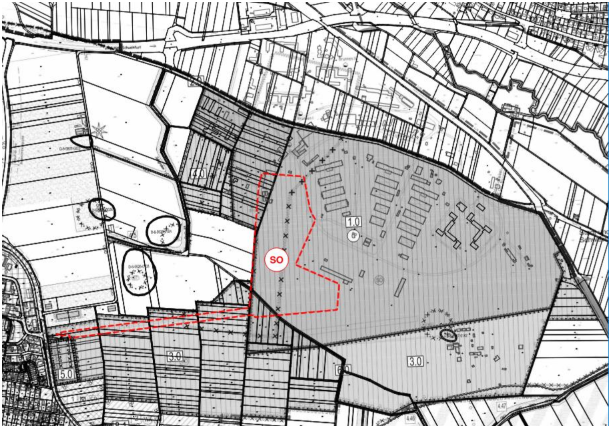
Abb. 5: Lageplan Kataster mit 4. Änderung Flächennutzungsplan Gemeinde Geldersheim (Fassung vom 26.01.2023) – Rot Geltungsbereich 5. Änderung Flächennutzungsplan Gemeinde Geldersheim Bereich „Conn Barracks“