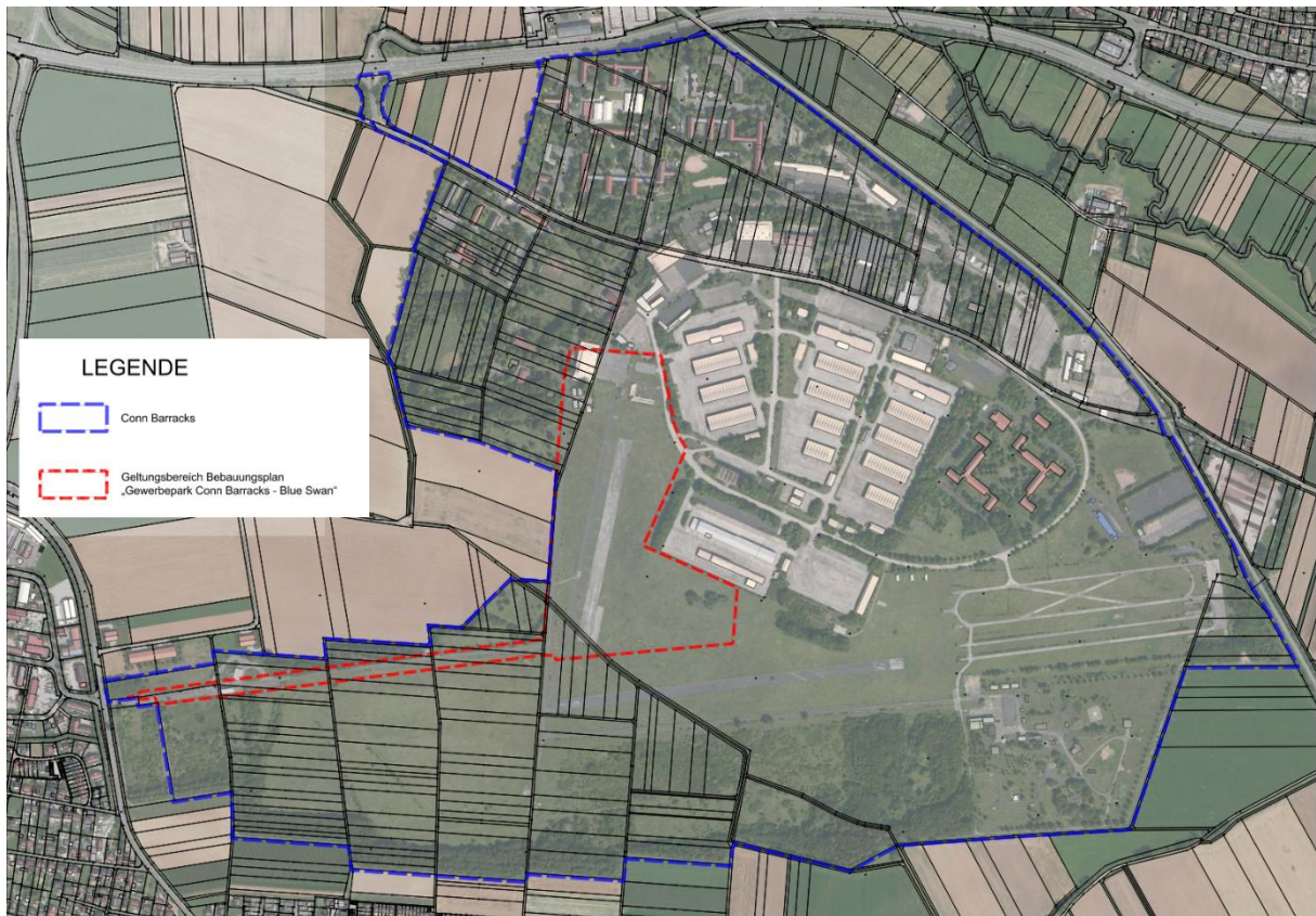
Abb. 4: Lageplan Kataster mit Luftbild – Blau Gesamtbereich der Conn Barracks – Rot Geltungsbereich Bebauungsplan „Gewerbepark Conn Barracks - Blue Swan“

Der vorliegende Aufstellungsbeschluss behandelt die 5. Änderung des Flächennutzungsplanes der Gemeinde Geldersheim, Bereich Conn Barracks. Der Änderungsbereich umfasst eine Größe von 15,1 ha. Die Änderung wird erforderlich, um eine Entwicklung des Bebauungsplanes „Gewerbepark Conn Barracks – Blue Swan“, „Sonstiges Sondergebiet“ (SO) gemäß § 11 BauNVO (Baunutzungsverordnung) mit der Zweckbestimmung „Datacenter“ aus dem Flächennutzungsplan gemäß § 8 Abs. 2 BauGB zu gewährleisten. Hierfür muss ein Teilbereich der Gewerblichen Baufläche des Flächennutzungsplanes der Gemeinde Geldersheim entsprechend in „Sonstiges Sondergebiet“ (SO) gemäß § 11 BauNVO mit der Zweckbestimmung „Datacenter“ geändert werden.