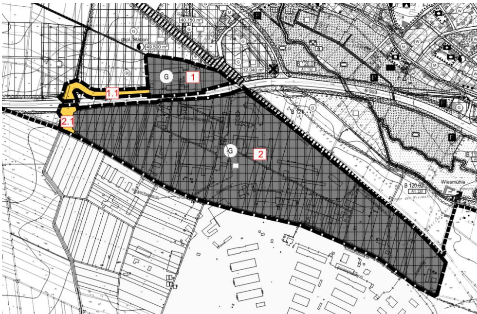
Abb. 2: Auszug aus der 4. Änderung Flächennutzungsplan Gemeinde Niederwerrn (Fassung vom 24.10.2017)