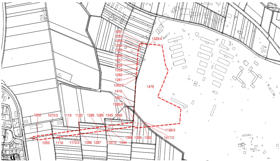
Abb. 6: Übersicht der Flurstücke im Geltungsbereich – Rot Geltungsbereich 5. Änderung des Flächennutzungsplanes der Gemeinde Geldersheim (Kataster: Bayerische Vermessungsverwaltung)

Das Plangebiet wird im Norden und Osten durch einen überwiegend bebauten Bereich des ehemaligen Kasernenareals begrenzt. Im Süden wird das Plangebiet überwiegend durch die Sukzessionsflächen im Bereich der ehemaligen Start- und Landebahnen der Kaserne begrenzt. Im Westen wird das Plangebiet durch Gehölz- und Grünflächen sowie durch Ackerflächen begrenzt, während es im äußersten Westen an den Geltungsbereich des Bebauungsplanverfahrens der Gemeinde Geldersheim „Am alten Flugplatz“ anschließt.