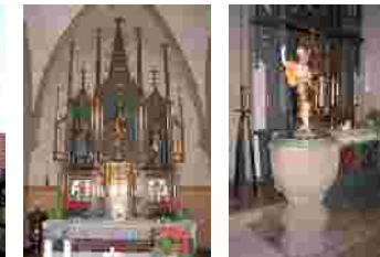
Altar und Taufbecken in der St. Laurentius Kirche in Kronungen

Eine Mariensäule, alte Fachwerkhäuser sowie ein Jakobusbildstock von 1553 (östlich der B 19 Richtung Maibach) sind sehenswerte Zeugnisse des Ortes. Die nächste Station ist Kronungen , wo die kath. Pfarrkirche St. Laurentius innen reizvolle Rankenmalereien aufweist.