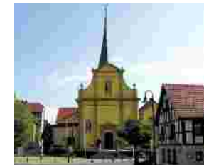
Jakobuskirche in Poppenhausen

Auf den Spuren der Muschel unterwegs nach Santiago de Compostela zum Grab des Apostels Jakobus d.Ä. Von Fulda kommend verläuft der Jakobusweg über den Kreuzberg und Bad Kissingen durch das Obere Werntal nach Würzburg. Die reizvolle Landschaft und die sehenswerten Kirchen, die zahlreichen Bildstöcke am Weg als Zeichen der Volksfrömmigkeit, stille Einkehr und Besinnlichkeit, aber auch die gemütliche Rast in einem Gasthaus machen den Aufenthalt und den Weg im Oberen Werntal zu einem Erlebnis. Ausgehend von Bad Kissingen über Wirmsthal und vorbei an Ramsthal führt der Pilgerweg zunächst durch ein Waldstück nahe Ebenhausen (Gemeinde Oerlenbach) und weiter in die Flur "Altenfelder Hof". Durch herrliche Felder gelangen wir über die Altenfelderhofstraße direkt ins Obere Werntal nach Poppenhausen zur kath. Pfarrkirche St. Jakobus mit ihrem Echarturm von 1517.