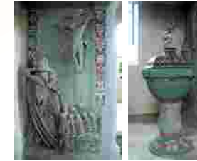
Seitenaltar und Taufbecken in der St. Cosmas Kirche in Euerbach

Wir verlassen Kronungen und folgen einem schnurgeraden Flurweg nach Euerbach . Sehenswert sind im Ort die nach Plänen von Balthasar Neumann im Stil des Rokoko erbaute kath. Pfarrkirche St. Michael, die Kirchenburg mit ihren Gaden und die evang. Dorfkirche St. Cosmas und Damian sowie ein Jakobusbildstock von 1518.