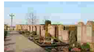
Sandsteinfriedhof in Egenhausen

■ = Übernachtungsmöglichkeiten am Jakobusweg im Oberen Werntal