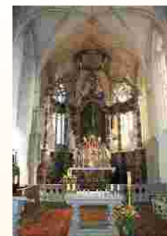
Spätgotischer Altar in der Wallfahrtskirche Maria Heimsuchung in Eckartshausen