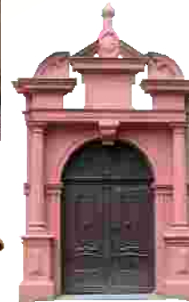
Kirchenportal der St. Nikolaus Kirche in Geldersheim