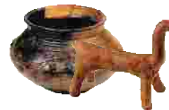
Früheste Spuren der Besiedlung aus der Jungsteinzeit bis hin zu späteren Zeugnissen der Handwerkskunst der Germanen sind im Geldersheimer Museum zu bewundern.