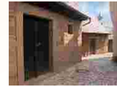
Kirchburg in Euerbach