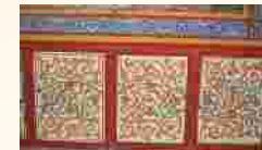
Rankenmalerei in der kath. Pfarrkirche St. Laurentius in Kronungen