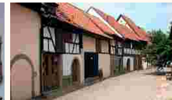
Altar der St. Nikolaus Kirche und Kirchgaden in Geldersheim

Wir verlassen Geldersheim in westlicher Richtung nach Egenhausen , Reizvoll ist die kath. Pfarrkirche St. Johannes der Täufer, eine der schönsten Spätrokokokirchen in Franken. Der Kirche schließt sich ein sehr stilvoller Friedhof an, dessen Grabdenkmäler allesamt in Sandstein gehalten sind. Besuchen Sie in Vasbühl, abweichend vom offiziellen Jakobusweg, die sehenswerte Wallfahrtskirche St. Jakobus d.Ä. mit Rokoko-Hochaltar.