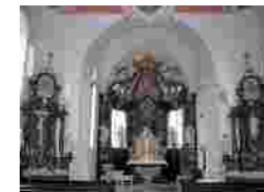
Kath. Pfarrkirche St. Johannes der Täufer in Egenhausen