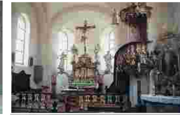
Rokokoaltar in der St. Michaels Kirche in Euerbach

Entlang des Biegenbaches und durch den Muhlgrund gelangen wir nach Geldersheim , wo unser Pilgerweg auf die Route des Jakobusweges Schweinfurt • Würzburg trifft. Geldersheim ist eine ehemalige Kaiserpfalz. Die imposante Kirchenburg mit ihren Gaden, der kath. Pfarrkirche St. Nikolaus und der benachbarten romanischen Frühmesskapelle (heute evang. Kirche), ist die Sehenswürdigkeit des Dorfes. Der Ort zählt zu den bildstockreichsten Dörfern in Unterfranken. Einen Besuch ist auch das Archäologische Museum wert, das in einem Teil der Gaden untergebracht ist.