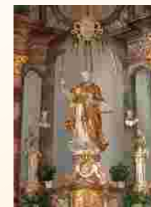
Jakobusfigur in der Rokoko-kirche in Schraudenbach